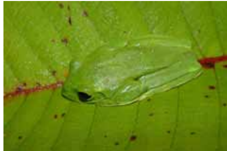
La rana de árbol Agalychnis moreletii

existe algún tipo de contaminante. Es casi seguro que en Las Cebollas habitan especies de esta índole ya que abundan los riachuelos y nacimientos de agua; durante el viaje de campo se escucho la vocalización de la rana de árbol