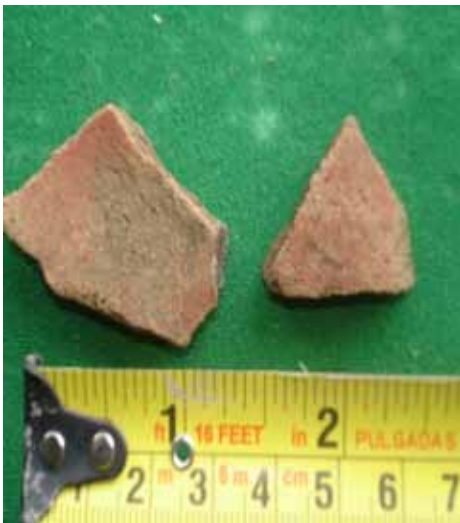
Restos de cerámica encontrados dentro de la cueva. Probablemente utilizado como ofrenda ritual.

a. Ocupación prehispánica: Se localiza en el área correspondiente al núcleo central de la Aldea, así como en el llamado grupo Las Milpas y la plantación de izotes. En el caso particular